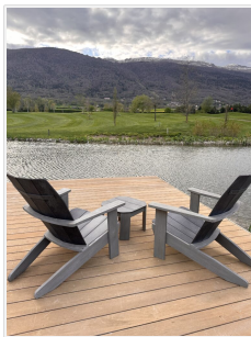
Au jardin

On aime l'architecture épurée qui laisse toute sa place à l'extérieur. Le lieu a été agrandi, mais on s'en rend compte à peine. La belle entrée, les salons doubles, les chambres zen mixant pierres, bois, avec leurs portes coulissantes, leurs baies vitrées avec balcons et vue sur les montagnes : un lieu unique, on vous le disait en liminaire.