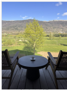
Balcon d'une chambre

Cet hôtel pas comme les autres, comme un lodge sud africain ou un ryokan japonais, mêlant esthétique scandinave et paysage de montagne et de verdure : vous le connaissez déjà, il était l'OVNI du pays de Ges, cette zone tampon qui jadis fut zone franche, entre Suisse et Jura français. C'est là un bout du département de l'Ain avec sa verdure, ses sommets paisibles, les souvenirs de Voltaire à Ferney, le golf et les cures d'eau à Divonne. Ce Jiva Hill Park Hotel, créé par un Suédois amoureux de l'Afrique, Ian Ludin, propriétaire également du Six Senses à Crans Montana.